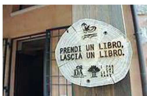
Nella foto grande l'arco di San Rocco, a Pico (Frosinone), nel Parco Tommaso Landolfi. Dall'alto in basso: la fortezza viscontea a Cassano d'Adda nel Parco Manzoni ; Vernazza, Parco Montale; un cartello ad Anversa