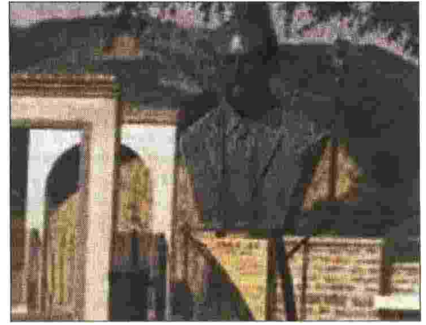
Da sinistra Isabella Morra, Albino Pierro e Carlo Levi