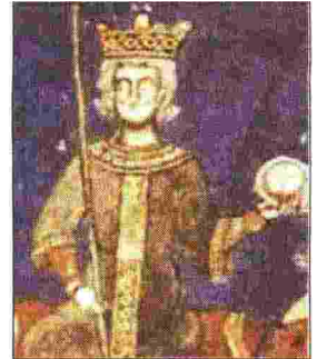
Federico II di Svevia